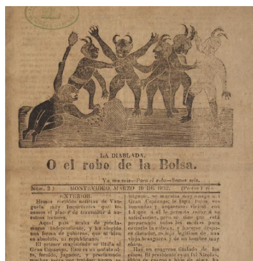
Imagen 2. Portada del número 2 de La Diablada .

LD explicó que “el grupo de figuras [era] un remedo de la descripción que se hizo de una lámina en un número del Recopilador” 14 , en referencia a una nota sin título que dicho periódico incluyera en su edición del 25 de febrero. Ésta presentaba una “canción diablesca” inspirada en un “cuadro alegórico ... que se halla en poder de un sujeto aficionado a las bellas artes”. El texto, sin proporcionar datos que permitieran reconocer la obra, la describió en estos términos: