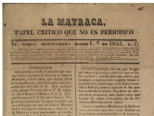
Imagen 1. Portada del primer número de La Matraca .